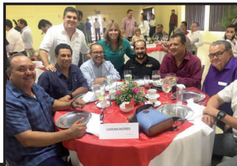
Trabajadores de la Industria y de la Radio (STIRT), y Directivos de Medios de Comunicación, en Dialogo con la Gobernadora, Claudia Pavlovich Arellano